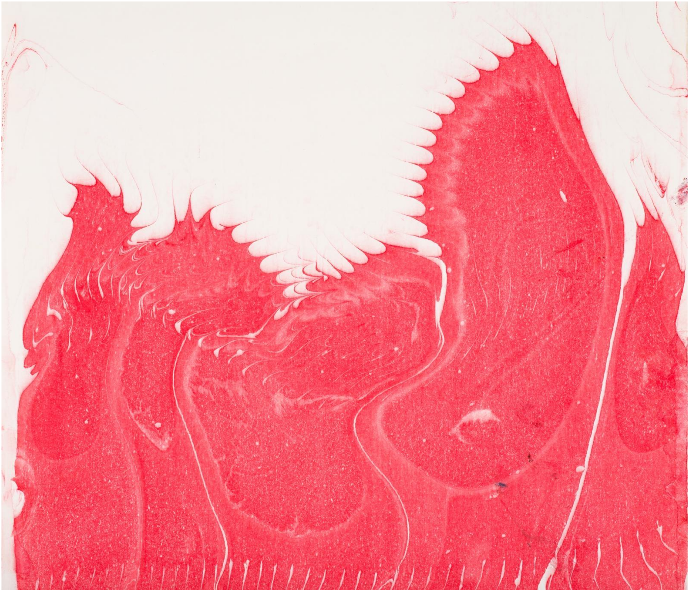
2025, 40x30 cm, Technique mixte sur papier

Un même atelier, une même pratique et deux œuvres autonomes, qui se rencontrent et entretiennent un lien tacite et complémentaire. Une même sensibilité autour de cette pratique traditionnelle, que seul l'enseignement auprès d'un maître permet d'en comprendre et maîtriser les rudiments. Un art ancestral de la patience, de l'attention et de l'anticipation, du geste lent et mesuré, du geste vif et opportun. L'apprentissage de la persévérance, rythmé par de nombreuses « révélations » et « accidents ».