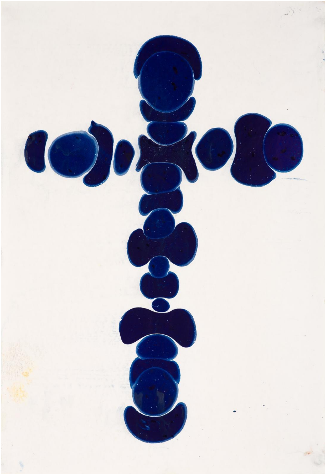
2025, 50x35 cm, Technique mixte sur papier