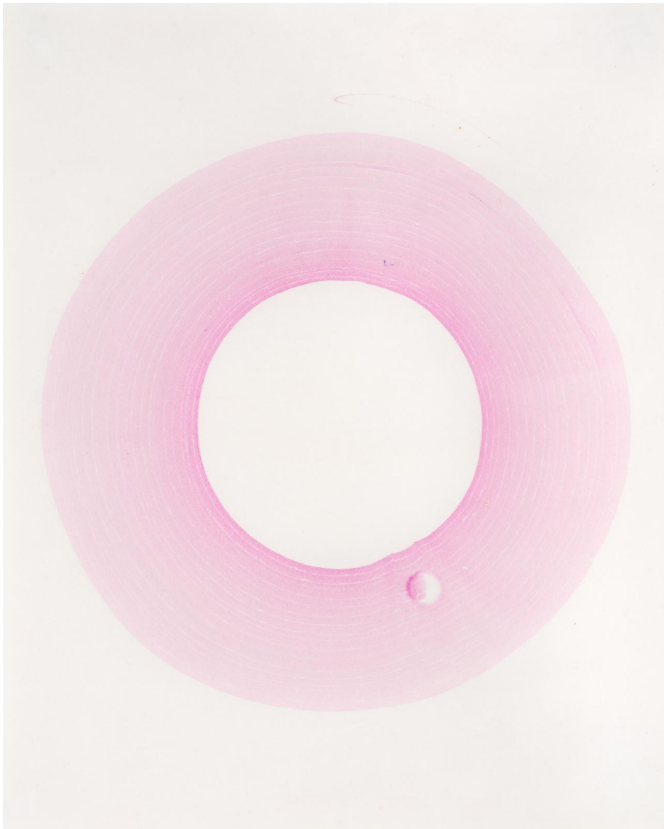
2025, 30x30 cm, Technique mixte sur papier

Leur travail se situe entre l'expérience respectueuse d'un savoir-faire traditionnel et sa nouvelle expression dans le champ contemporain.